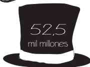
Royal Bank Scotland